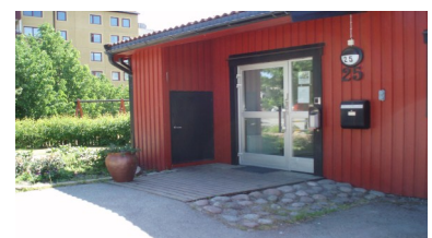
Föreningslokalen, Tuvvägen 25.

Sedan en tid tillbaka har föreningen även en hobbylokal där medlemmar kan snickra, måla osv. Det går även att låna föreningens släpvagn för att transportera bort avfall.