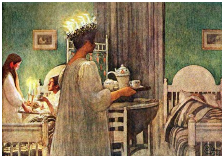
"Lucia" av Carl Larsson, hämtad från http://www.filindeblogg.nu

Torsdagen den 13 december kl.18.00 bjöd BRF Mimer in alla medlemmar på luciafika i föreningslokalen. Det bjöds på glögg med tilltugg samt godis till barnen. Allt som allt kom 22 glada medlemmar till