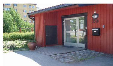
Föreningslokalen, Tuvvägen 25.

Sedan en tid tillbaka har föreningen även en hobbylokal där medlemmar kan snickra, måla osv. Det går även att låna föreningens släpvagn för att transportera bort avfall.